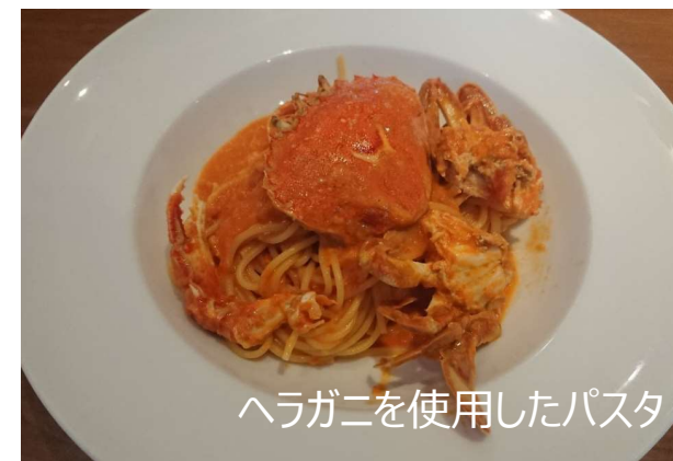
ヘラガニを使用したパスタ