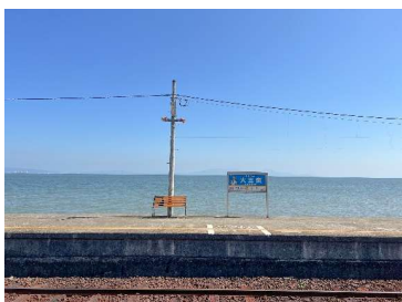
島原鉄道大三東駅