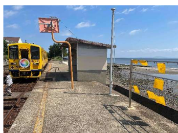
幸せの黄色いハンカチ