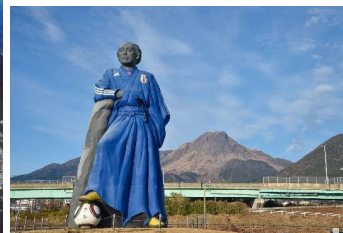
サムライブルー龍馬像 (平成新山をバックに)