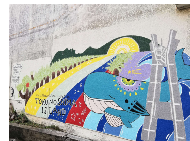
平土野アートプロジェクト