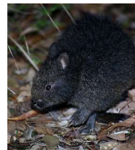
アマミノクロウサギ

全6話のストーリーがYoutubeで公開され、映文連アワード2022で優秀作品賞（準グランプリ）を受賞した。（現在は公開されておられません。）