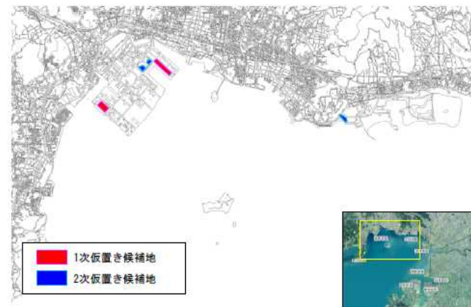
発災時の漂流物仮置きヤードの候補地に関する計画策定事例(三河港)