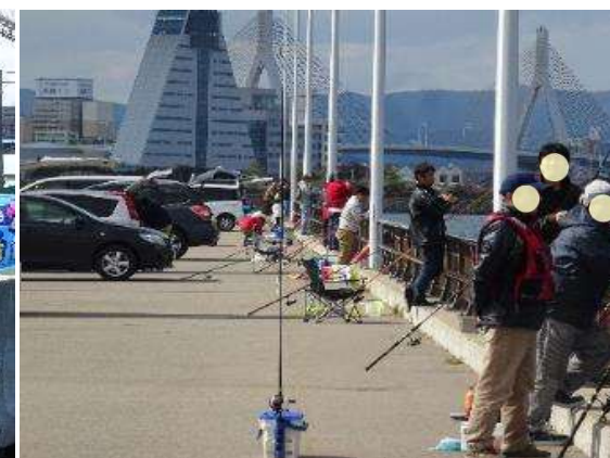
▲釣り限定開放(令和2年10月18日)浜町緑地