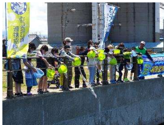
▲稚魚の放流(令和2年6月21日)浜町緑地