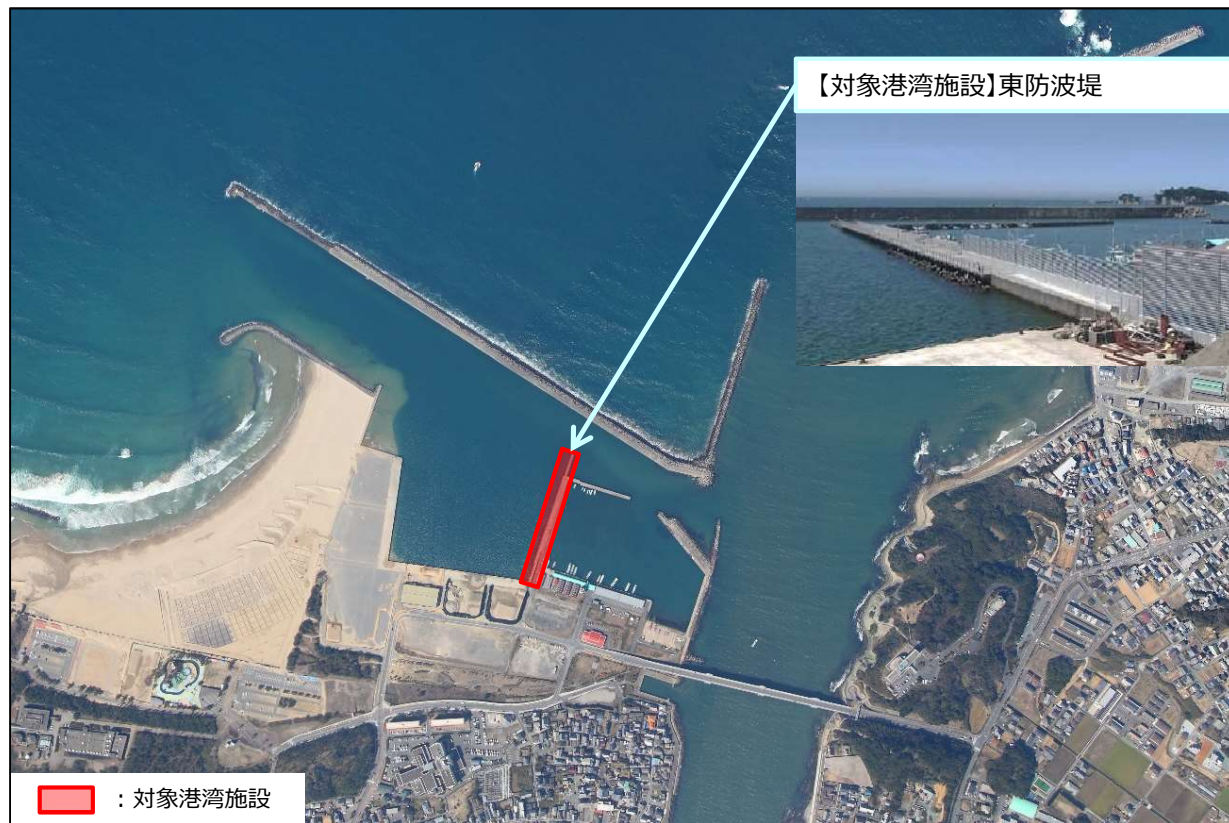
【対象港湾施設】東防波堤