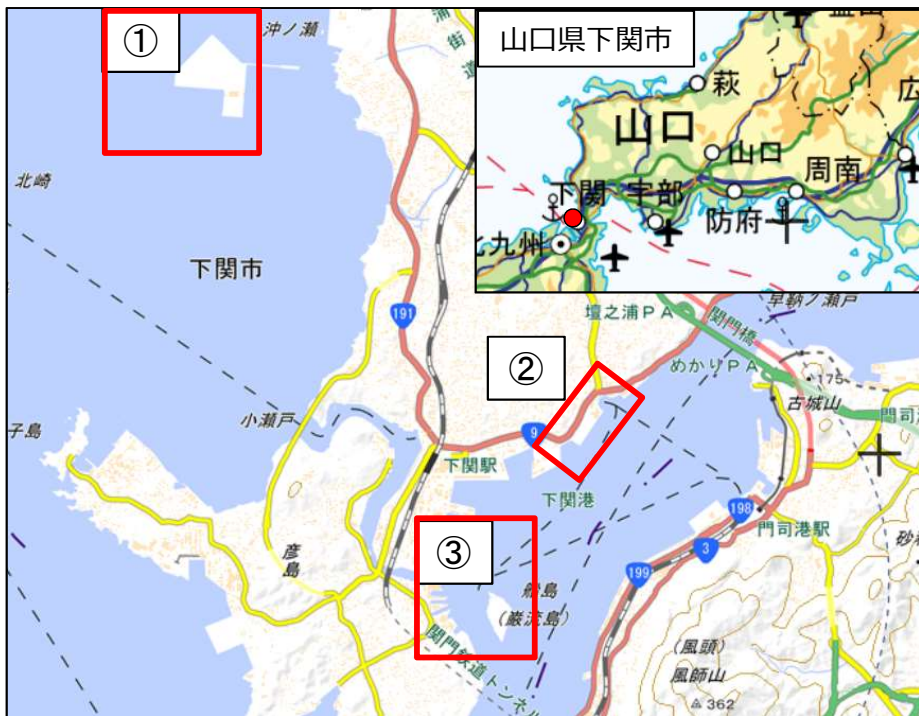
国土地理院地図（電子国土Web）( http://maps.gsi.go.jp )をもとに国土交通省作成