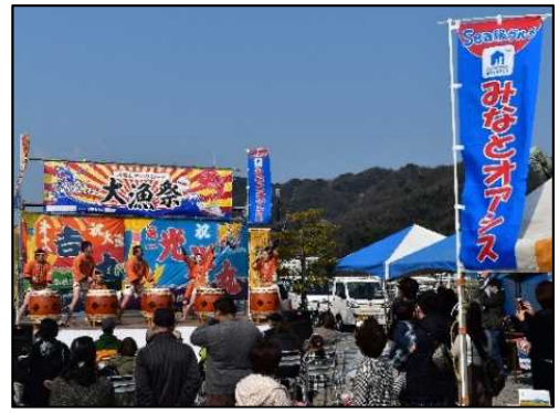
地域振興イベントの開催状況