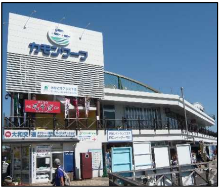
構成施設のイメージ