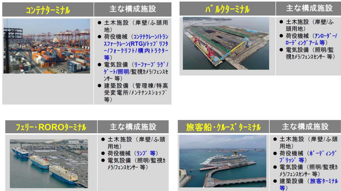
図1 港湾のターミナルの種類と主な構成施設