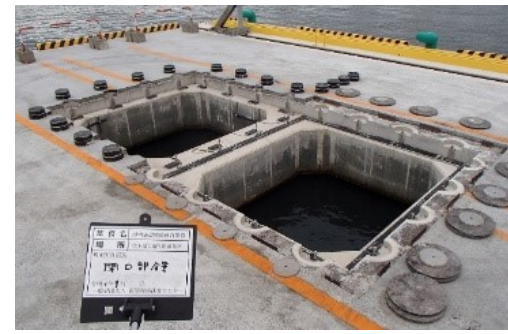
施工性確認試験実施状況(床版撤去)