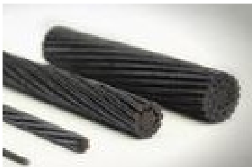
炭素繊維強化プラスチック(CFRP)