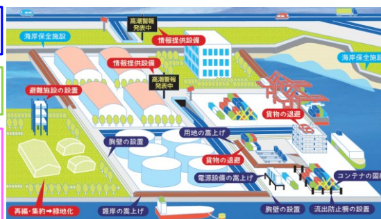
■協働防護に係る対策例(イメージ)

※2022年には東証プライム市場において、財務に影響を及ぼす気候関連情報の開示が実質義務化