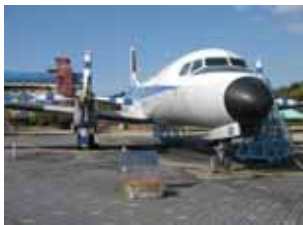
展示物イメージ(航空産業) (提案事業:事業主体 名古屋市)