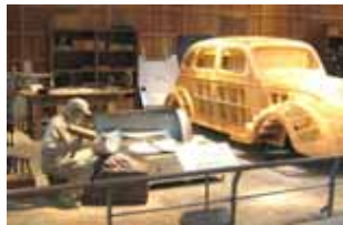
展示物イメージ(自動車産業) (提案事業:事業主体 名古屋市)