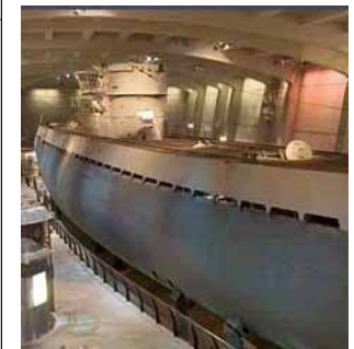
展示物イメージ(船舶模型) (提案事業:事業主体 名古屋市)