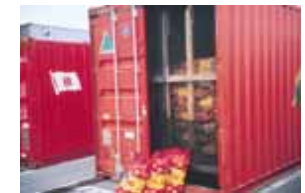
展示物イメージ(コンテナ内容物) (提案事業:事業主体 名古屋市)