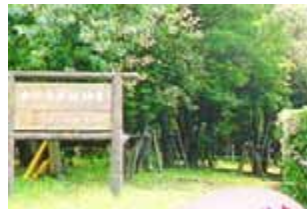
案内看板のイメージ (提案事業:事業主体 名古屋市)