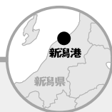
●新潟港外貿コンテナ取扱実績

国際海上コンテナターミナルの整備により地域産業の活性化が図られた。 コンテナ貨物量は毎年順調な伸びを示し、平成15年はコンテナ貨物取扱量が過去最高になる。 中国・東南アジア等からの軽工業品（家具装備品、衣類・身廻品・履物等）の輸入拡大や、中国向けの古紙等の輸出が堅調で、今後も確実に伸びが見込まれている。