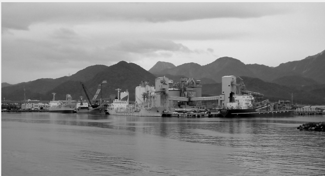
西埠頭・中央ふ頭に接岸するセメント船