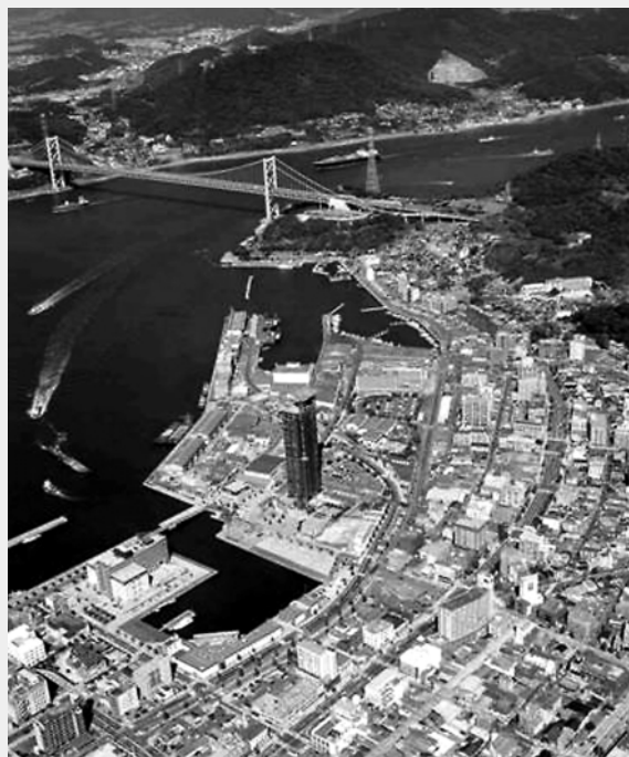
遊歩道・サイクリングロード（和布刈～門司港レトロ）