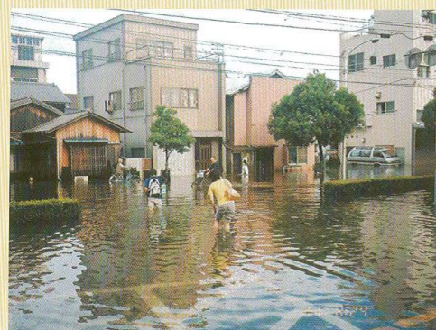
台風の高潮により浸水した市街地（香川県高松市）