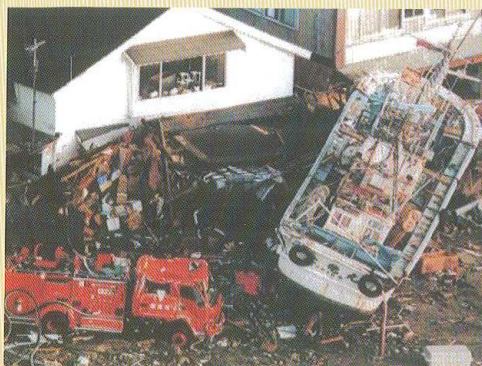
津波により民家の庭先まで流されてきた漁船（北海道奥尻島）