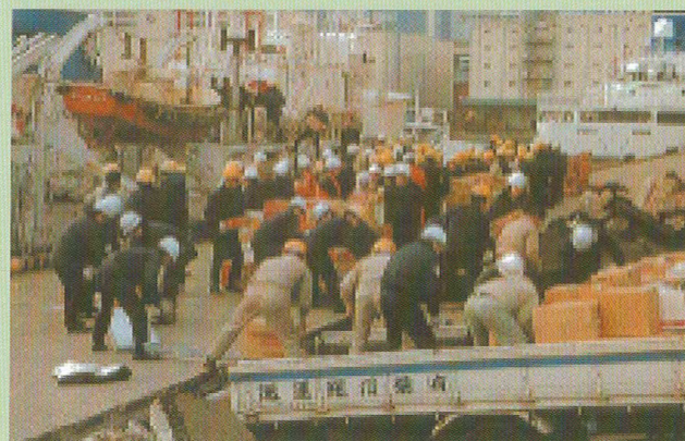
阪神・淡路大震災の時は、救援物資が各地から船を使って神戸のみなとに運ばれてきました。

昭和54年6月18日第三郵便物認可 育て！子どもたち 平成18年4月20日発行 第1354号 定価400円（毎週木曜日発行）発行所（株）産経広告社 〒101-0054 東京都千代田区神田錦町1-1 TEL 03-5259-7888