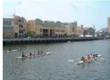
兵庫キャナルレガッタ