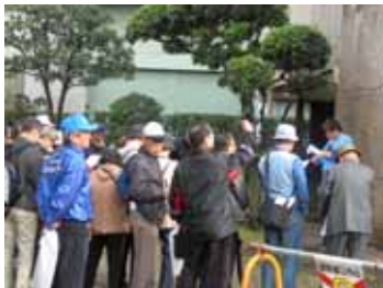
市民参加の工場見学会等