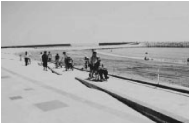
宮崎港海岸(宮崎県)