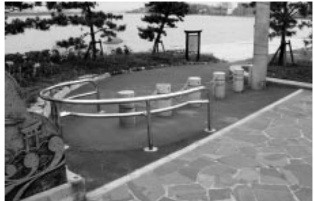
博多港海岸(福岡県)