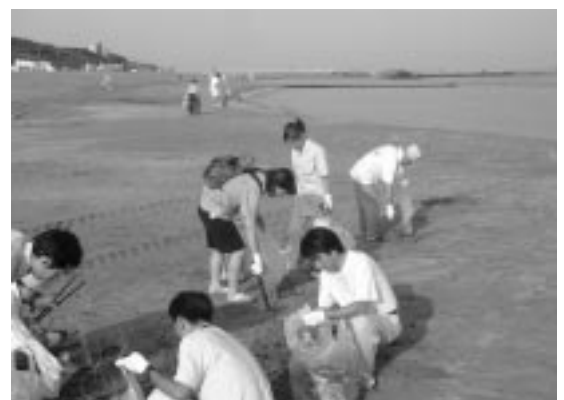
新潟港海岸(新潟県)