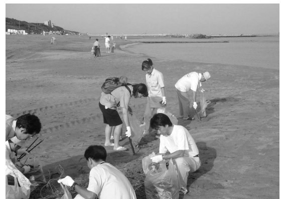
新潟港海岸(新潟県)