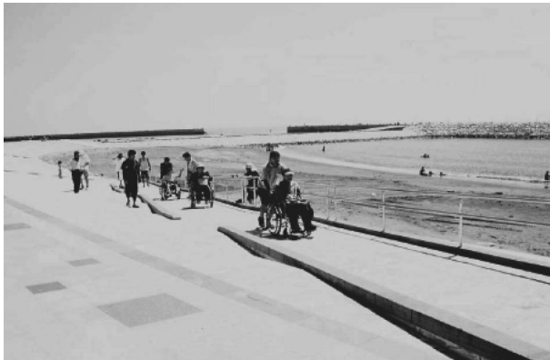
宮崎港海岸(宮崎県)