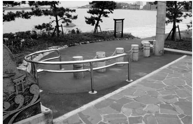
博多港海岸(福岡県)