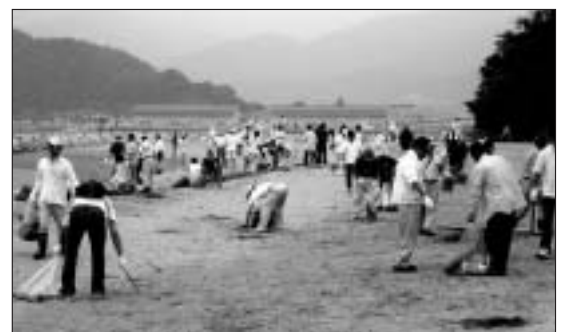
竹原港海岸（広島県）

地域の人々、行政、専門家の協働（パートナーシップ）により、人と海辺の関わりを深め、それぞれの地域の特性を活かした「海辺の文化」を創造することが必要である。