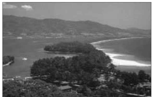
宮津港海岸（京都府）