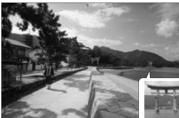
厳島港海岸（広島県）