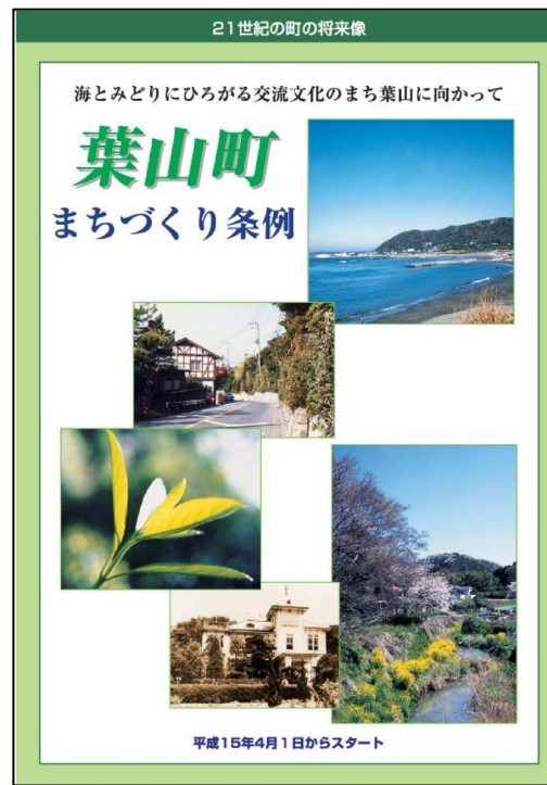
■葉山町まちづくり条例パンフレット