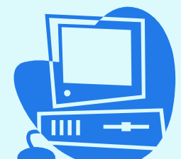
ホームページ等 での公表