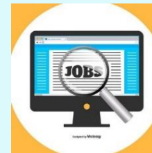
求人票に掲載可能