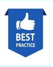
ベストプラクティス 事例集作成