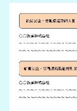
めざまし!海技者セミナー での受賞者掲示