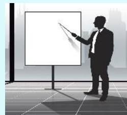
船員災害防止大会 等でプレゼン