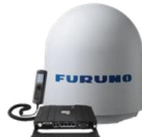
インマルサット衛星電話