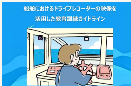
船舶におけるドライブレコーダーの映像を 活用した教育訓練ガイドライン