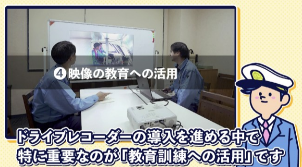
④ 映像の教育への活用