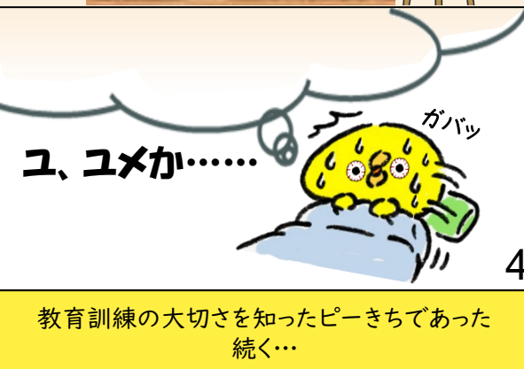
教育訓練の大切さを知ったピーきちであった 続く...