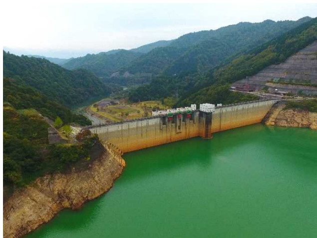
玉川ダム（令和元年10月3日撮影）