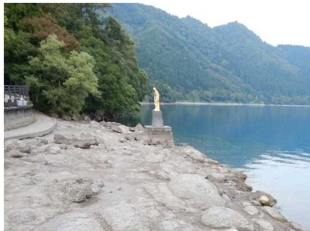
田沢湖（令和元年10月3日撮影）