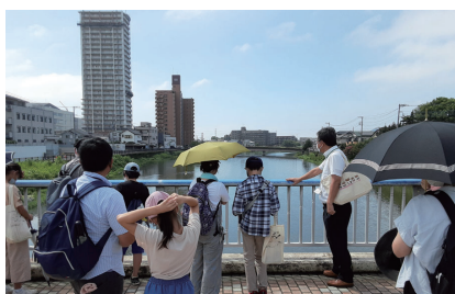
●「粕壁宿」の歴史散策