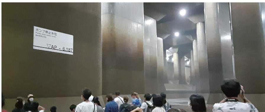
●首都圏外郭放水路「地下神殿コース」見学

春日部駅西口（集合）→首都圏外郭放水路（龍Q館にて川の国授業、「地下神殿コース」見学）→野口農園（ブルーベリー狩り、おにぎり作り体験、昼食、動物とのふれあい体験）→古利根公園橋→宿場町「粕壁宿」の歴史散策→春日部市郷土資料館（一日の振り返り、館内自由見学にて解散）