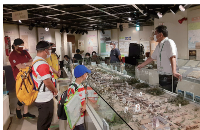
●春日部市郷土資料館