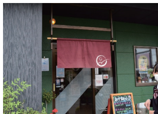
●むらやまぐるめぐり