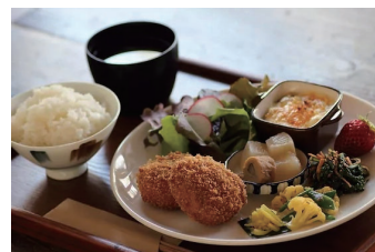
● 農園カフェ「つくる」ごはん定食