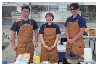
● 地域の方々との交流