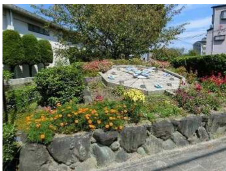
西農生が管理している花時計