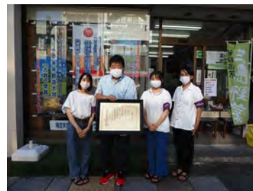
● グラウンドワーク三島