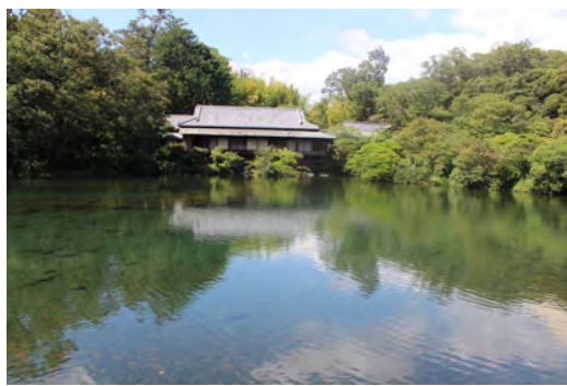
● 楽寿園 ～源兵衛川はじまりの地～