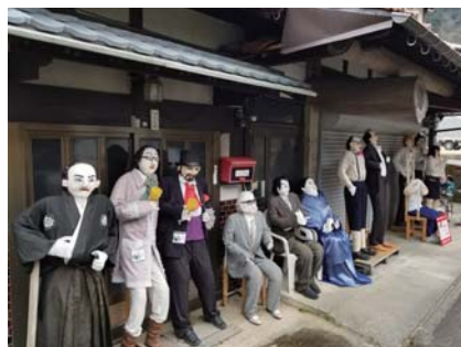
◎ リアルかかしの里山