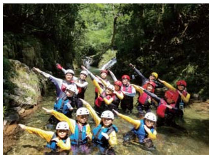
◎ シャワークライミング