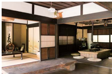
◎ 奥湯来田舎体験ハウス