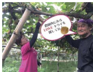
● 「幸せのキウイフルーツ」