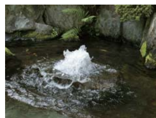
● 自噴するうちぬき