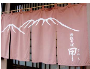
● 西條そば甲 外観