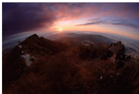
● 筑波山頂からの絶景