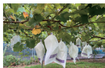
● 瀬尾果樹園のブドウ