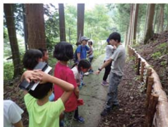
◎グリーンロードのトレッキング