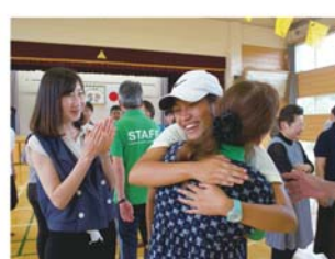
◎ お別れセレモニー