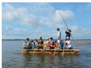
◎ 手づくりのイカダ乗り体験