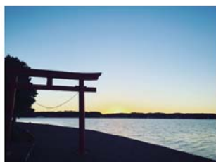
◎ 汽水湖 酒沼 (ひぬま)