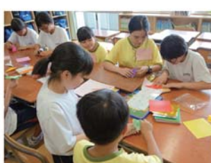
◎ 学校交流で異文化体験