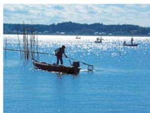
◎ 伝統的なシジミ漁の見学