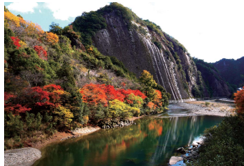
● 古座街道ウォーキング「一枚岩」