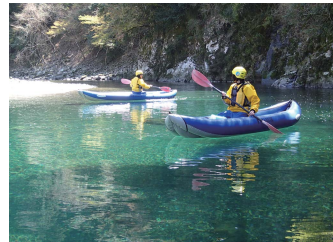
● 古座川ダッキー川坊