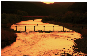
● 古座街道ウォーキング「潜水橋」