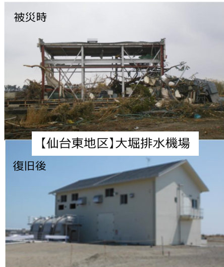
写真2-2 災害復旧事業の実施状況

農林水産省では、「東日本大震災からの農林水産業の復興支援のための取組」をとりまとめ公表している。の中で、基幹的農業用施設として主要な排水機場については、応急復旧を平成24年度末までに完了し、本格的な施設の復旧として令和3年（2021年）3月までに対象となる96機場が全て完了している。また、残りの施設についても、各地域の復興計画を踏まえつつ、早期の復旧を進めることとしている。