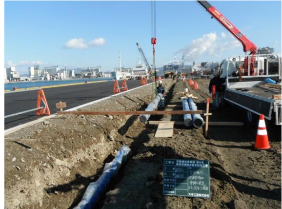
写真 1 - 1 水道管の復旧工事（宮城県石巻市）

東日本大震災により、19 都道府県の水道施設に被害があり、累計で約 257 万戸が断水した（ただし、福島第一原子力発電所事故の影響により、一部地域では調査が困難なことから、対象から除外している）。現在、津波により甚大な被害を受けた地域では、防災集団移転促進事業等の復興事業に合わせて水道施設の復旧が進められており、福島第一原子力発電所の事故による避難指示区域についても、避難指示解除に向けて復旧が進められているところである。（図 1 - 1）。