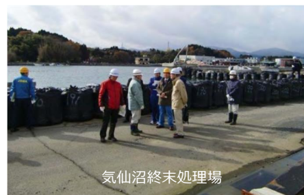
写真2-3 現地調査の様子