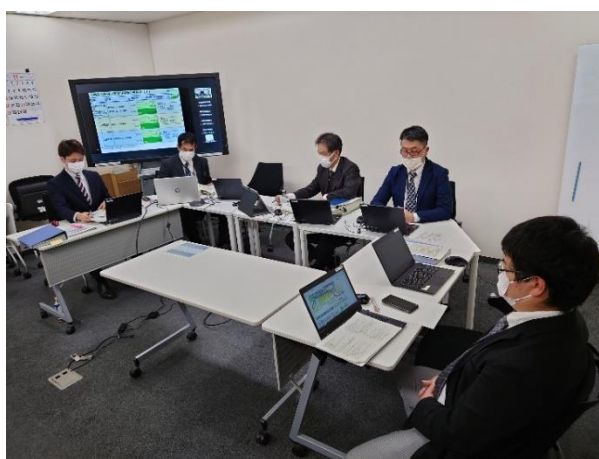
写真2-1 連絡協議会の開催実施（Web開催）

さらに、「復興・創生期間」後における東日本大震災からの復興の基本方針が令和元年12月20日に閣議決定され、『地震・津波被災地域』においては復興・創生期間後の5年間、『原子力災害被災地域』においては当面10年間、災害・復旧事業の支援が継続されることとなった。