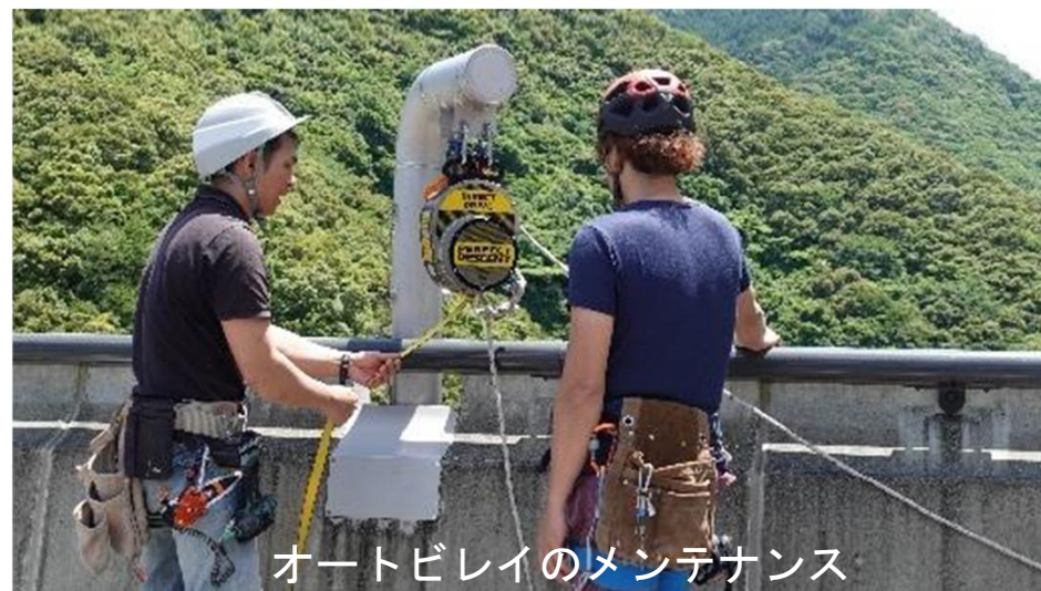
オートブレーキのメンテナンス