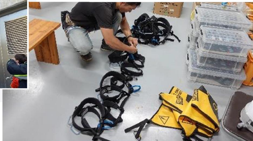
備品メンテナンス(ハーネスの点検)