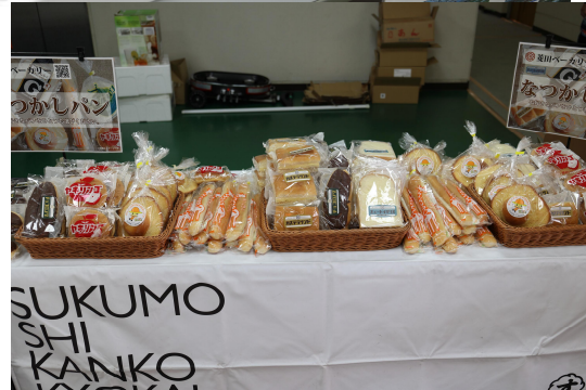
宿毛・愛南サイクル コネクト