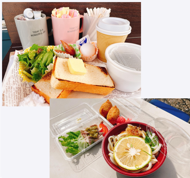
すくもグラベルまん ぷくライド