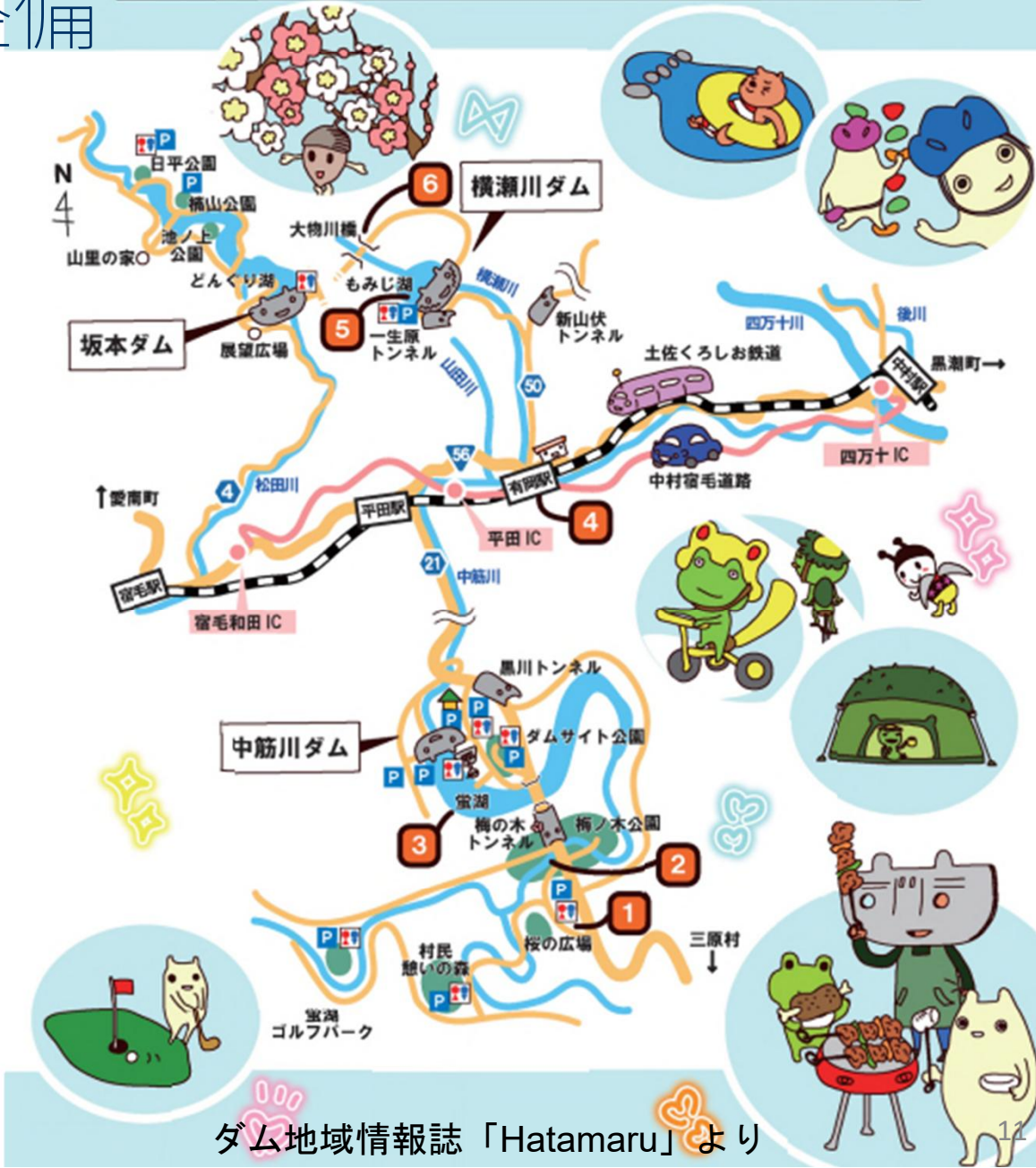
ダム地域情報誌「Hatamaru」より