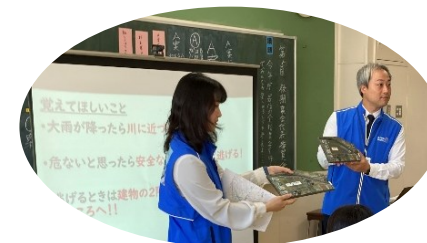
遊水地の説明の様子