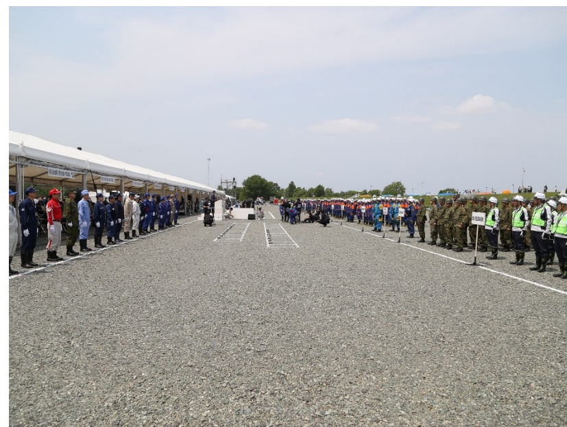
北海道石狩川水系忠別川総合水防演習（旭川）