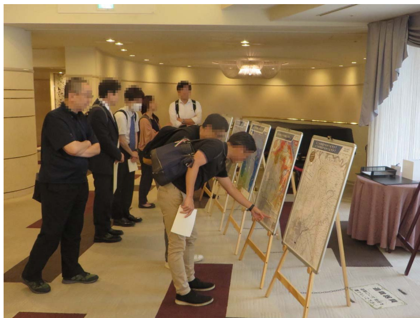
第1回 R I C 講演会 「流域治水」パネル展示

令和7年度 第1回 R I C 講演会 日時 令和7年7月22日 (火) 会場 ホテル札幌ガーデンパレス 2F