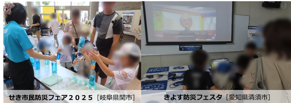
せき市民防災フェア2025 [岐阜県関市]