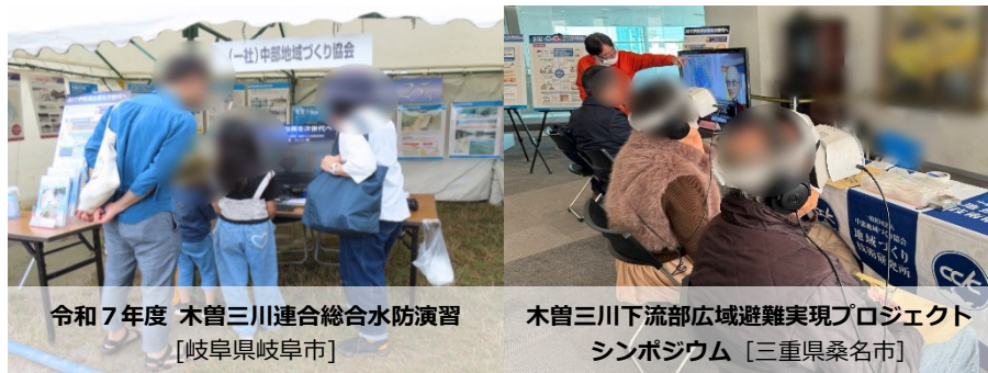
令和7年度 木曾三川連合総合水防演習 [岐阜県岐阜市]