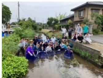
第24回研修会 (新潟県)