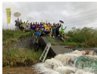
第25回研修会 (滋賀県)