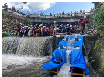
第23回研修会 (福井県)

5月から11月に地元の多様な主体が参画する「小さな自然再生」現地研修会を5回開催し、生態系保全のアプローチから流域治水を推進した。