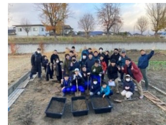
第27回研修会 (長野県)