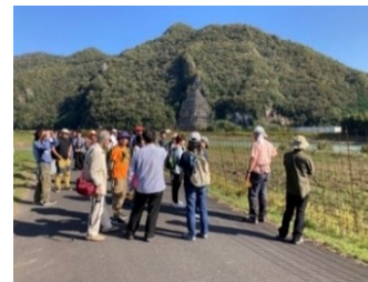
第26回研修会 (兵庫県)