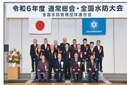
水防功労者表彰 (令和6年4月24日)