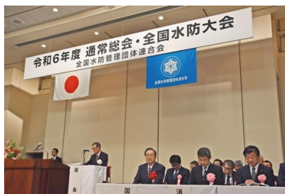
令和5年度全国水防大会 (令和6年4月24日)

・「危機管理型水位計運用協議会」の事務局として運営するとともに、システム事業者として閲覧システム「川の水位情報」を運用した。また、全国水防管理団体連合会（全水管）の事務局として、洪水時等に住民と地域の安全を担う全国の水防団及び水防団員の活動の支援を行った。