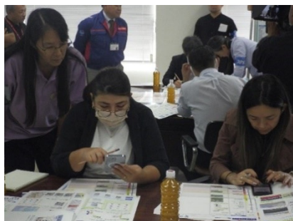
【在留外国人向け講習会】 在留外国人の企業代表者等を対象とした避難体験を取り入れた体験型講習

・水害時における住民の安全・安心な避難のため、地域の関係者と連携した「マイ・タイムライン作成リーダー育成研修会」を開催し、住民へのマイ・タイムラインの普及と活用促進を図った。