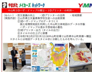
交流会展示ポスター