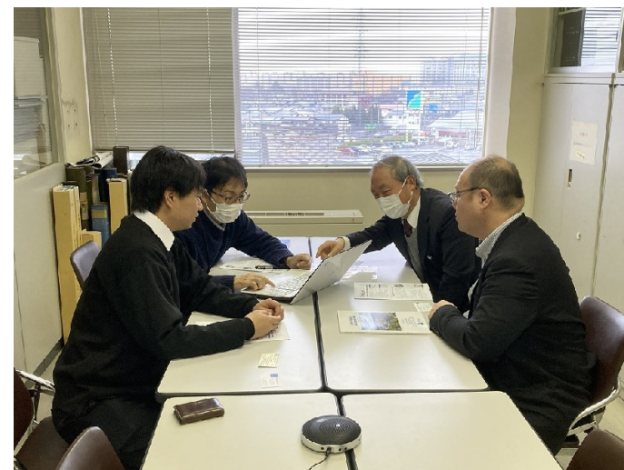
山形河川国道事務所との交流