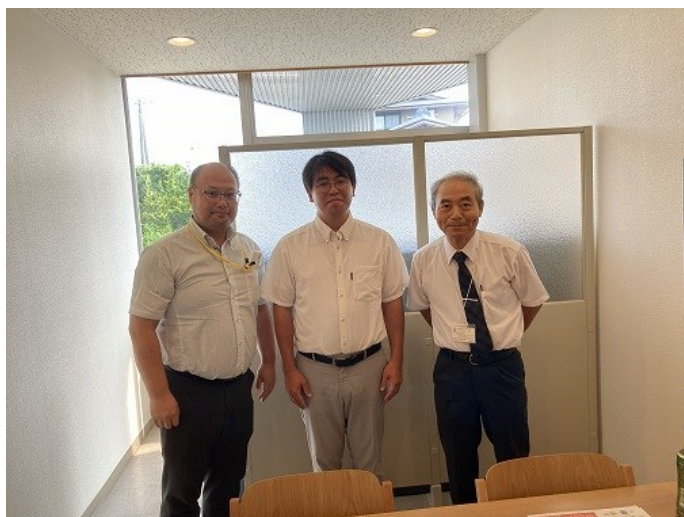
流域治水オフィシャルサポーター テイテイイー様との交流