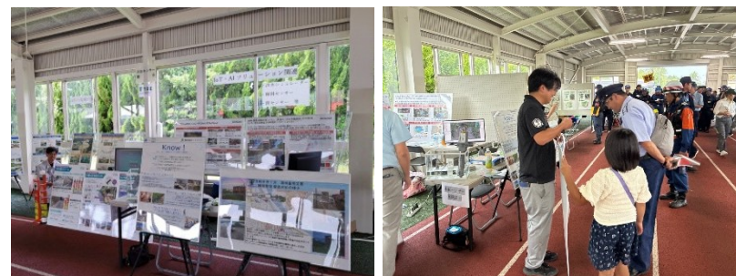
令和7年度 山形県・酒田市 合同防災演習での流域治水の展示

まずは「知ってもらう」「興味を持ってもらう」ということを軸に“ 気軽に話せる ”“ 親しみやすい ”広報・普及活動を行いました。