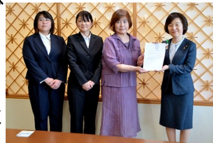
令和7年度 水防協力団体の活動

専門的な知識や資金がなくても「気軽に」できる水防協力の形を作っていくと共に、今までやっていた地域での活動が水防や流域治水に繋がると再認識していただければと考えております。