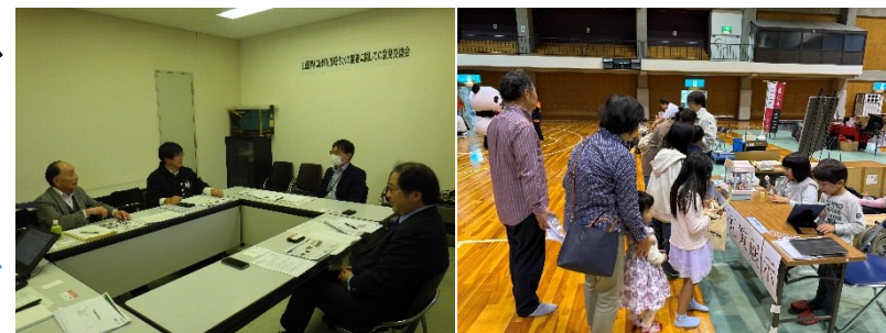
令和7年度 流域治水に関わる関係者同士の座談会や地域の方々との交流など

地域住民や民間企業から見ると、「 行政で何が困っているのか、何がしたいのかわからない、流域治水で何をしたらいいのかわからない 」という悩みがあり、また行政から見ると「 地域で何を協力していただけるのかわからない、どこまで協力いただけるのかわからない 」など、互いに「わからない」が多くあると感じておりました。だからこそ、立場にとらわれず、関係者が気軽に流域治水に関して意見交換を行い、お互いを知る場をいろいろと企画しております。