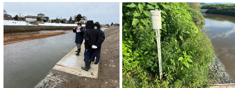
令和7年度 ワンコイン浸水センサ地域説明会および現場確認

DXやIOT機器が“ 地域でどう役立つか ”を、 弊社も共に地域を歩き、地域の特色を知り、共に考え、悩むこと で、様々な関係者に知見を貯めていただく活動を行っております。