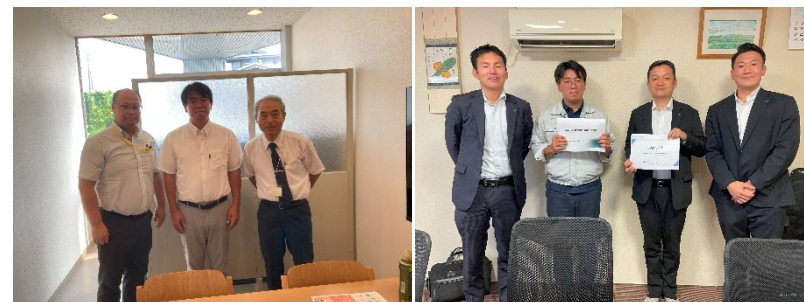
令和7年度 流域治水オフィシャルサポーター同士の意見交換 左：やまがたメイカーズネットワーク 様 右：三井住友海上火災保険 様

令和6年度より地場で活動されている流域治水オフィシャルサポーターや、全国の流域治水オフィシャルサポーターと交流を深めております。現在、さまざまな業種の企業や団体が流域治水オフィシャルサポーターになられております。そういったさまざまな関係者と意見交換をすることで 新しい考えや価値観の発見に繋げると共に、よりよい地域にできるように切磋琢磨 しております。