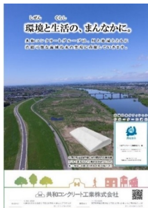
ポスター・チラシ（表）

(2)流域治水に関する広報資料の配布、掲示、アナウンス 流域治水に関するオリジナルポスターやチラシ等を作成し、社内やイベント等での掲示・配布により、サポーター制度や認定企業である事を周知しました。