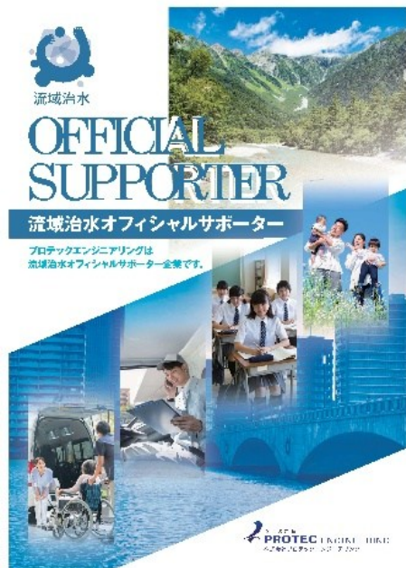
作成したポスター

展示会出展に伴い、社内で基本的な考え方から取組む目的と内容を共有。また、名刺に「流域治水オフィシャルサポーター」と印字し、社外でも取組内容を説明できるよう教育を行った。