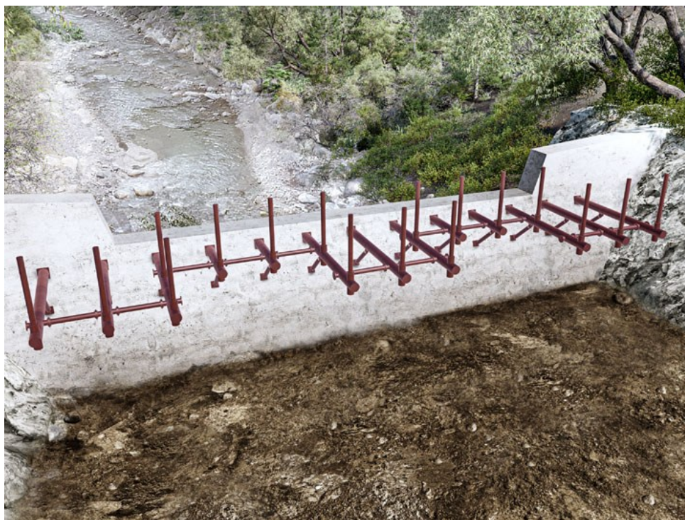
不透過型砂防堰堤に設置する流木捕捉工

「氾濫をできるだけ防ぐ・減らすための対策」として砂防関係施設の整備、森林整備・治山対策に関連する新製品を開発した。