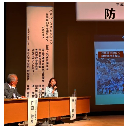
防災学習会（豊岡） パネリスト