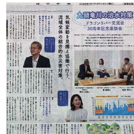
九頭竜川紙面座談会への参加