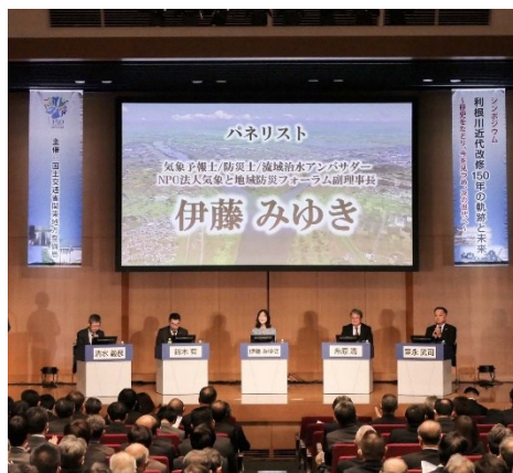
利根川近代改修150年の軌跡と未来シンポジウム

令和7年度は、HPでロゴマークを掲示、江戸川学習会の開催とともに、流域治水アンバサダー（防災気象情報）の活動を精力的に行いました。