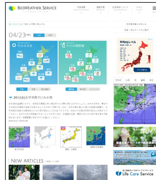
気象情報配信サービスのwebサイト