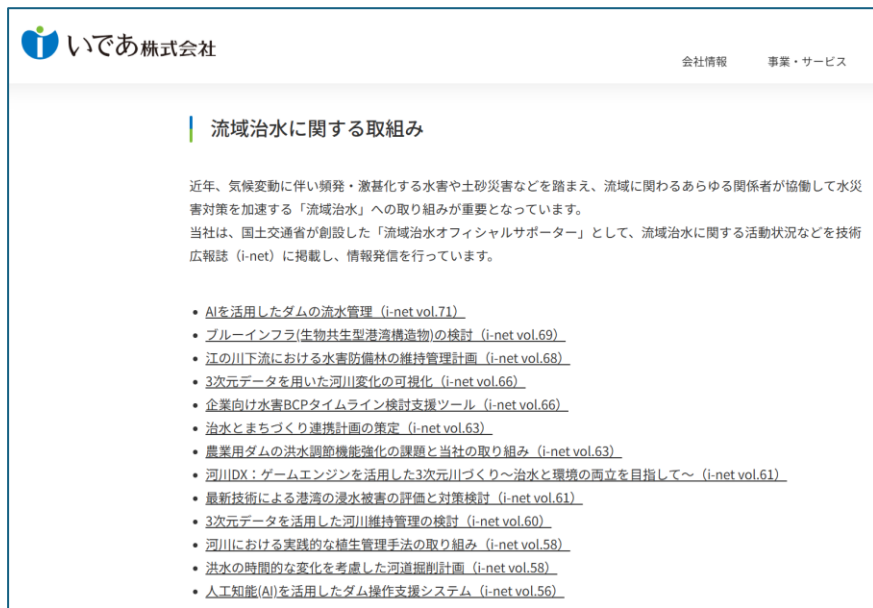
当社ホームページ